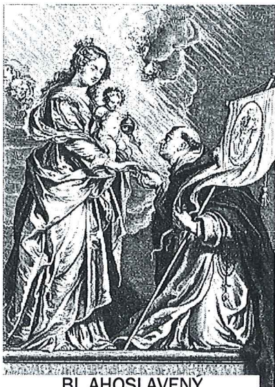
BLAHOŠLAVENÝ ALAN DE ROCHE

Blahoslavený Alan de la Roche, jak říká týž Carthagena, uvádí několik dalších zjevení našeho Pána a Panny Marie svatému Dominikovi, jež ho měla stále více rozplameňovat a pobízet k šíření svatého růžence, aby tak ničil hřích a obracel hříšníky a kacíře.